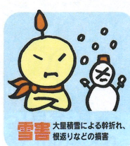
雪害 大雪積雪による幹折れ、根返りなどの損害