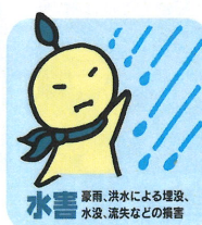
水害 暴雨、洪水による埋没、水没、流失などの損害