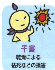
干害 乾燥による枯死などの損害