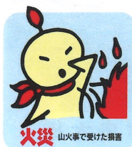
火災 山火事で受けた損害