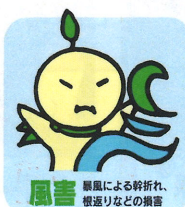
風害 暴風による幹折れ、根返りなどの損害