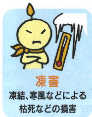
凍害 凍結、寒風などによる枯死などの損害