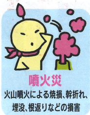
噴火災 火山噴火による焼損、幹折れ、埋没、根返りなどの損害