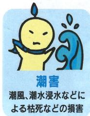
潮害 潮風、潮水浸水などによる枯死などの損害